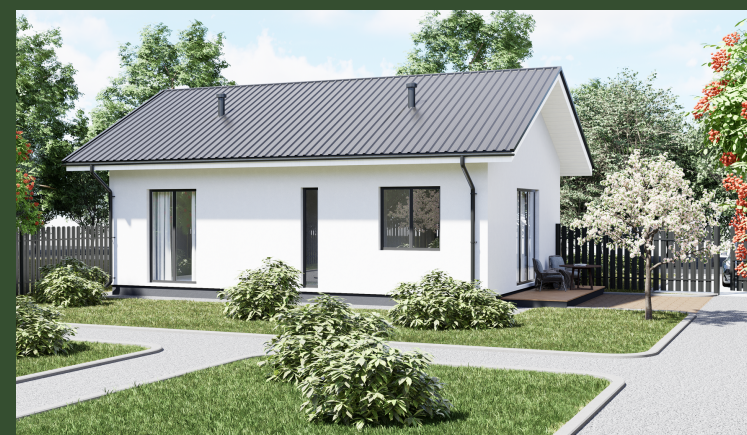
ДОМ С ТЕРРАСОЙ